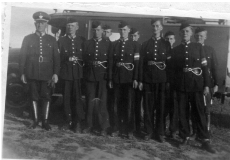
Siegergruppe in Plön

Am 28. Juni wurde die I. H.J. Gruppe bei dem Kampfsportfest die Siegergruppe.